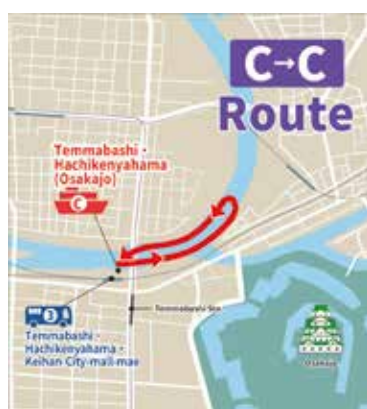
CC. 天満橋 - 天馬橋 クルーズ時間 25 分