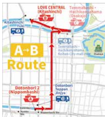
AB. 道頓堀 - ラブセントラル クルーズ時間 40 分