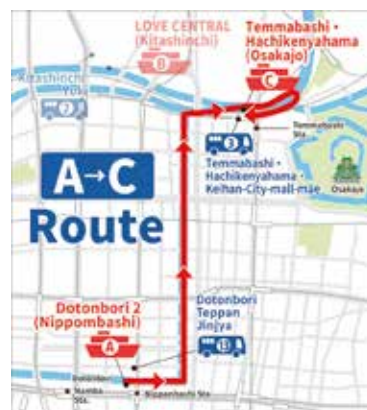
交流. 道頓堀 - 天満橋 クルーズ時間 40 分