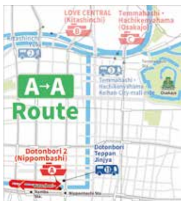
AA. 道頓堀 - 道頓堀 クルーズ時間 25 分