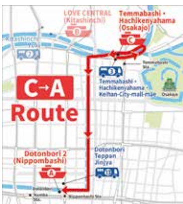
CA. 天満橋 - 道頓堀 クルーズ時間 40 分