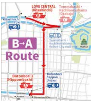
BA. ラブセントラル - 道頓堀 クルーズ時間 40 分